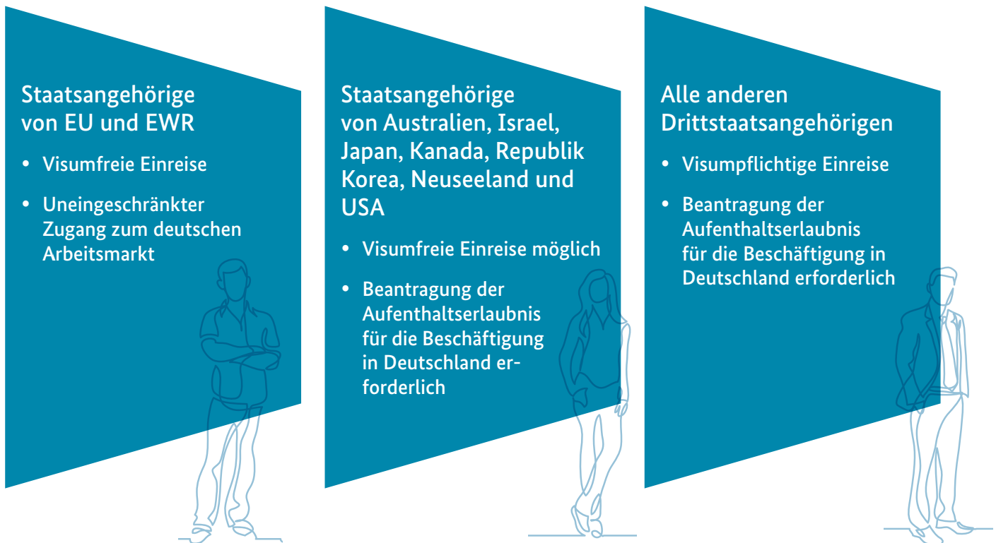
Abbildung 1: Zugang zum Arbeitsmarkt - Wer braucht ein Visum?

Die Bundesrepublik Deutschland hat, was die Einreise und den Zuzug von Fachkräften betrifft, mit einigen Staaten besondere Abkommen, die eine visumfreie Einreise ermöglichen. Für alle anderen gelten je nach Einreisezweck unterschiedliche Visaregelungen.