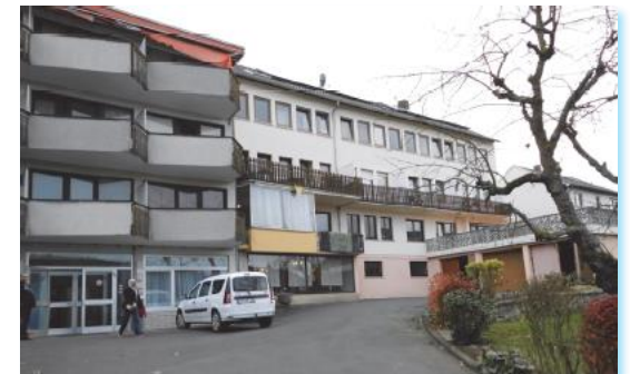
- Haus Hedwig -